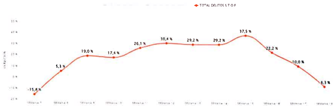
GRÁFICO DE EVOLUCIÓN PARA LOS DELITOS VIOLENTOS, CONTRA LA PROPIEDAD Y TOTAL DELITOS S T O P