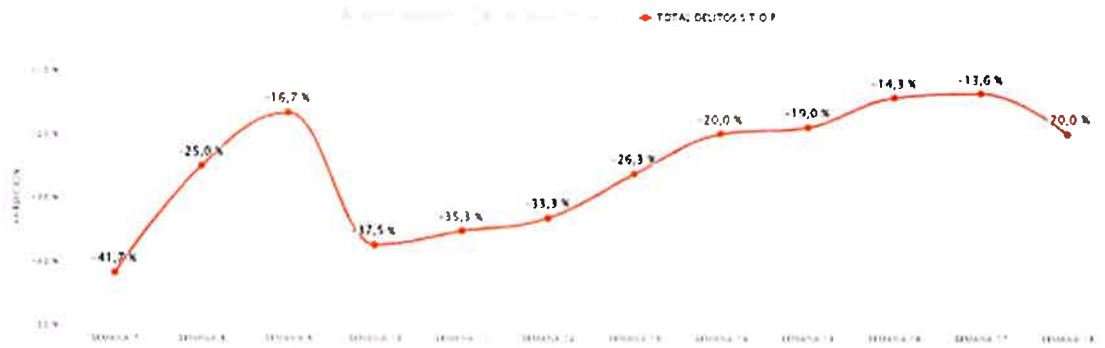
GRAFICO DE EVOLUCIÓN PARA LOS DELITOS VIOLENTOS, CONTRA LA PROPIEDAD Y TOTAL DELITOS S.T.O.P